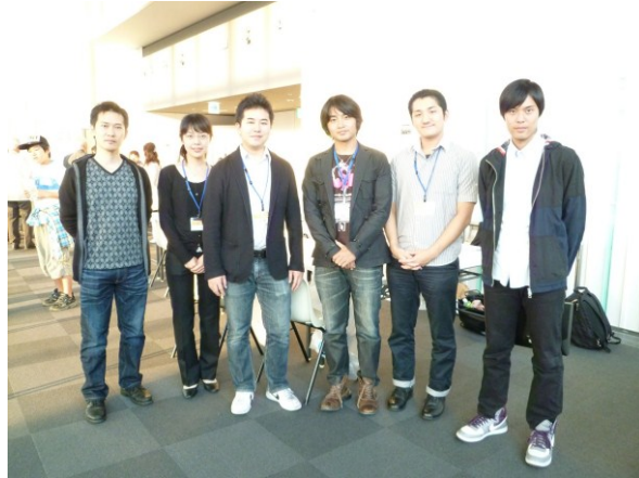
写真 2-2: 千葉市科学フェスタの参加者集合写真 (平成 23 年 10 月 9 日)