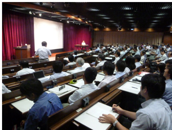
写真1-1: 福島第一発電所事故対応シンポジウムIの様子 写真1-2: 福島第一発電所事故対応シンポジウムIの様子

(2) 千葉県科学フェスタ2011への参加報告(若手研主査 明治大学 小池裕也)