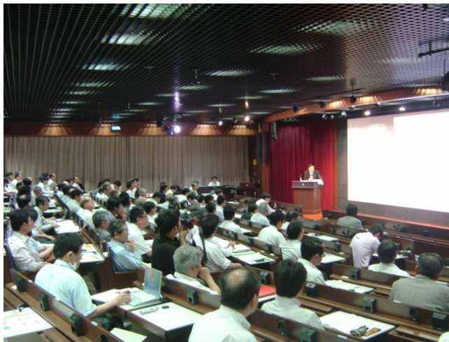
写真：シンポジウム会場の様子

を実感した。今回のシンポジウムで議論が不十分であった議題については8月に開催される第二弾にて取り上げる予定である。今後の福島第一発電所事故を取り巻く情勢に注目しながら、第二弾での討論を心待ちにしたいと思う。