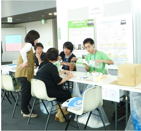
写真 2-1: 出展ブースの様子 (平成 23 年 10 月 10 日)